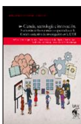
Producción bibliográfica desarrollada en coautoría